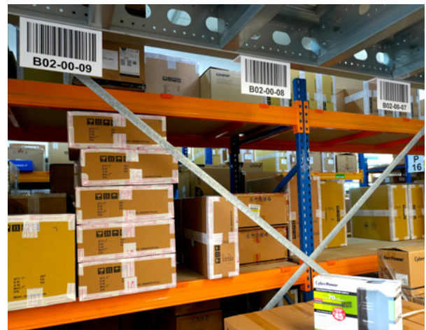
Tablice podwieszane - oznakowanie miejsc odkładczych.