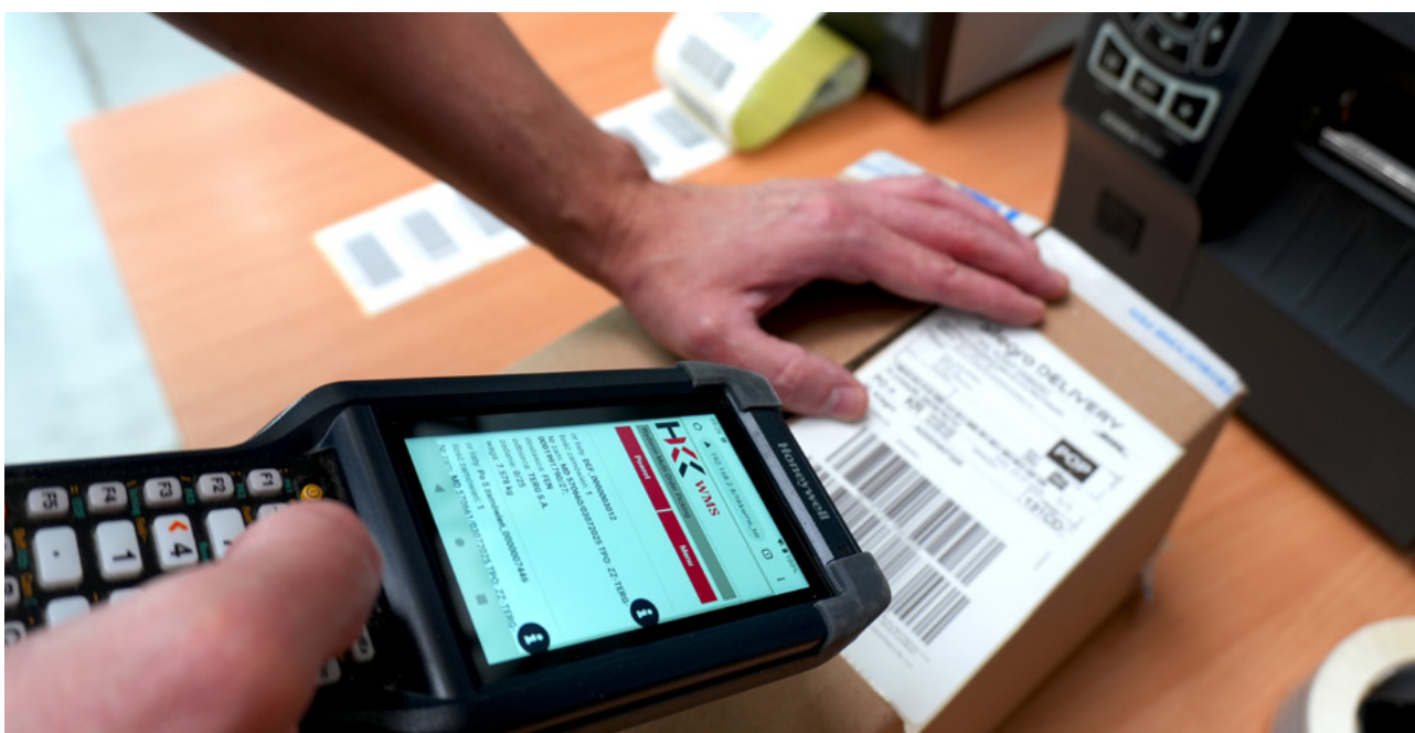
Systemowe potwierdzenie gotowości towaru do przekazania Kurierowi.