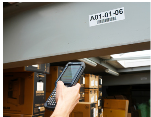
Etykiety lokalizacyjne WMS - adres sekcji magazynu