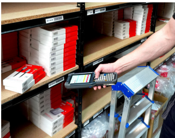
Kompletacja - pobranie produktów z regału.