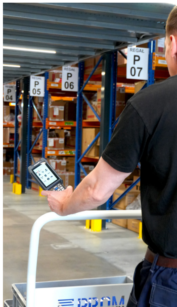
Terminal mobilny Honeywell CK65.