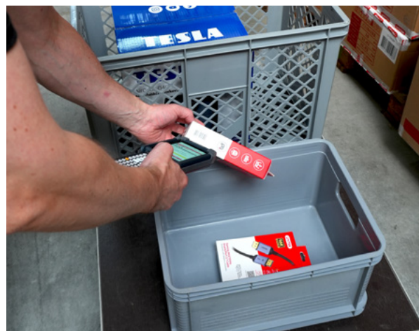
Kompletacja multi order picking - wózek i pojemniki.