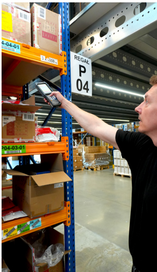
Odczyt lokalizacji systemowych WMS.