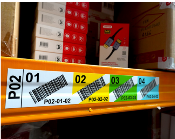
Etykiety lokalizacyjne WMS.