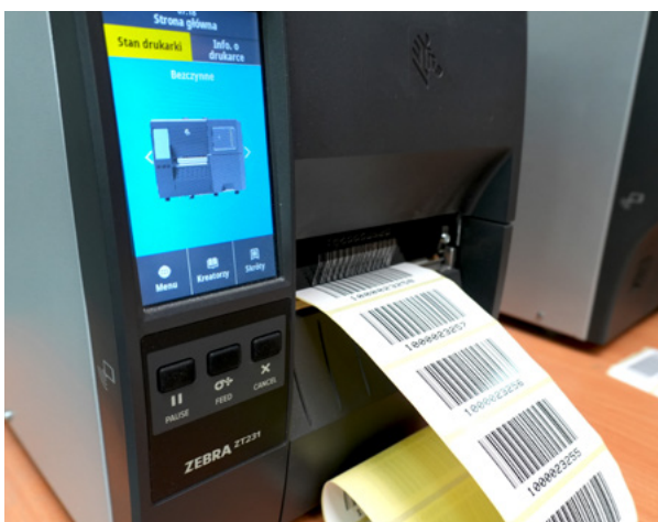
Drukarka etykiet Zebra ZT231 na stanowisku operatora.