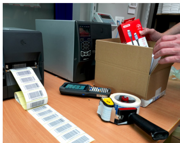
Przygotowanie towaru do wysyłki.