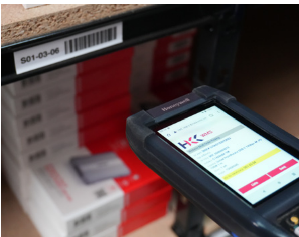
Oznakowanie regałowe - etykiety lokalizacyjne WMS.