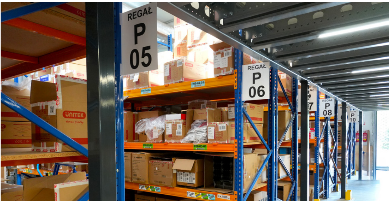
Oznakowanie alejkowe, regałowe oraz etykiety lokalizacyjne WMS.